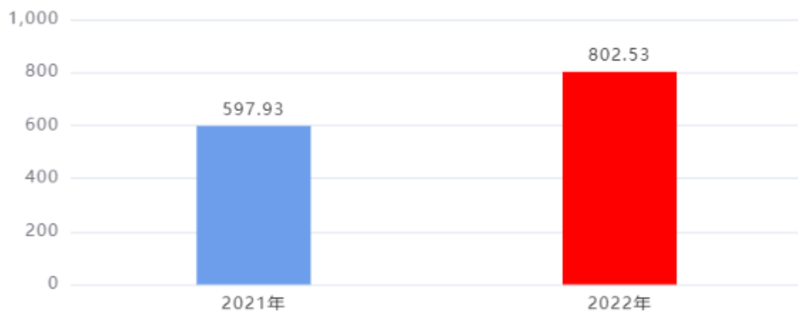
财政拨款收入、支出总计对比图 (单位：万元)

2022年度财政拨款收入总计、支出总计均为802.53万元，与上年相比收入总计、支出总计均增加204.6万元，增长34.22%，增长的主要原因是：人员工资调整，社保及公用经费增加。