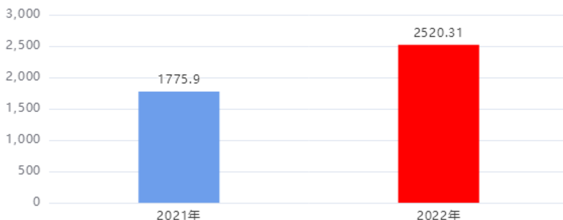
财政拨款收入、支出总计对比图 (单位：万元)

2022年度财政拨款收入总计、支出总计均为2,520.31万元，与上年相比收入总计、支出总计均增加744.41万元，增长41.92%，增长的主要原因是：疫情灾情等原因支出增加。