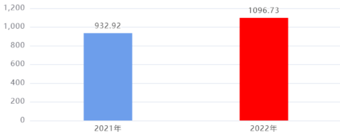
财政拨款收入、支出总计对比图 (单位：万元)

2022年度财政拨款收入总计、支出总计均为1,096.73万元，与上年相比收入总计、支出总计均增加163.81万元，增长17.56%，增长的主要原因是：人员增加，纪检监察案件查办等业务量增大。