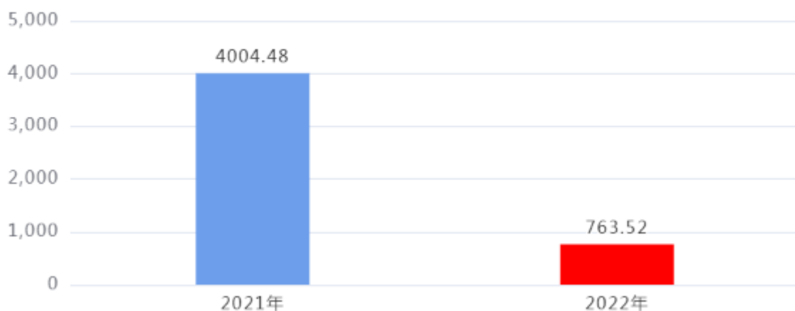
财政拨款收入、支出总计对比图 (单位：万元)

2022年度财政拨款收入总计、支出总计均为763.52万元，与上年相比收入总计、支出总计均减少3,240.96万元，下降80.93%，下降的主要原因是：本年征地项目支出减少。