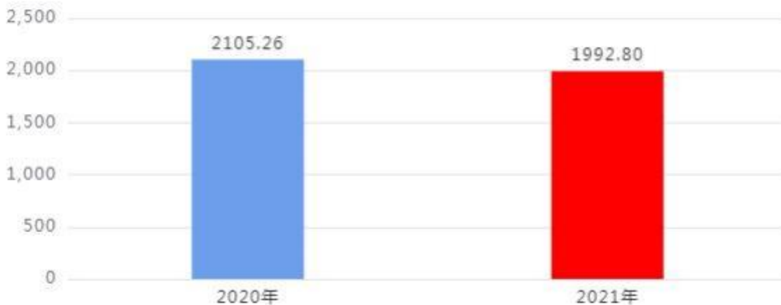
财政拨款收入、支出总计对比图（单位：万元）

本年度财政拨款收入、支出总计均为1,992.80万元，与上年相比减少112.46万元，下降5.34%，下降的主要原因是：人员数减少。