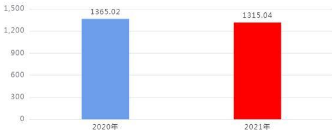
财政拨款收入、支出总计对比图（单位：万元）

本年度财政拨款收入、支出总计均为1,315.04万元，与上年相比减少49.98万元，下降3.66%，下降的主要原因是：项目资金减少，收入支出减少。