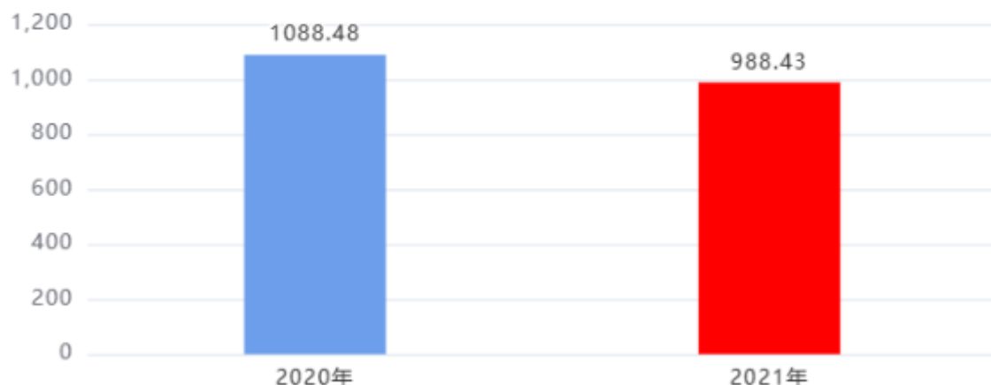
收入、支出决算总计对比图（单位：万元）

本年度收入、支出总计均为988.43万元，与上年相比减少100.05万元，下降9.19%，下降的主要原因是： 企业贷款 贴息资金减少。